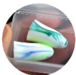
Bouchons à usage unique

Selon l'article R.4434-8 du Code du Travail, les protecteurs auditifs individuels sont choisis après avis des travailleurs intéressés.