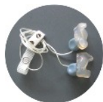
Bouchons moulés sur mesure