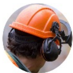
Coquilles sur casque anti-choc