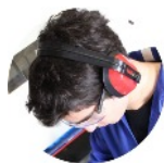
Coquille sur serre-tête